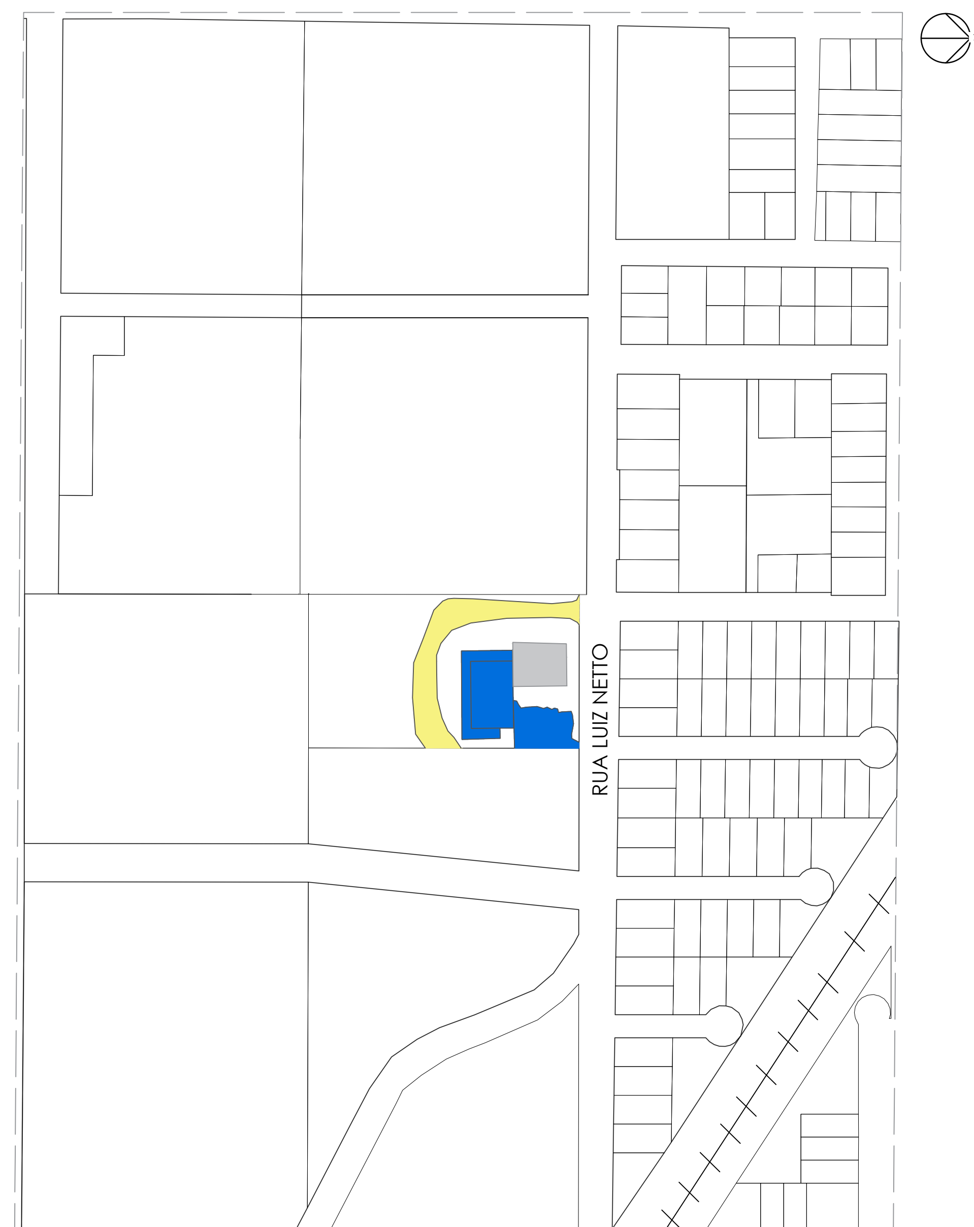
SITUAÇÃO ESC.: 1/2000